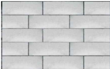
Gạch bê-tông nhẹ 12,5 viên/m 2 (10cm x 20cm x 40cm)